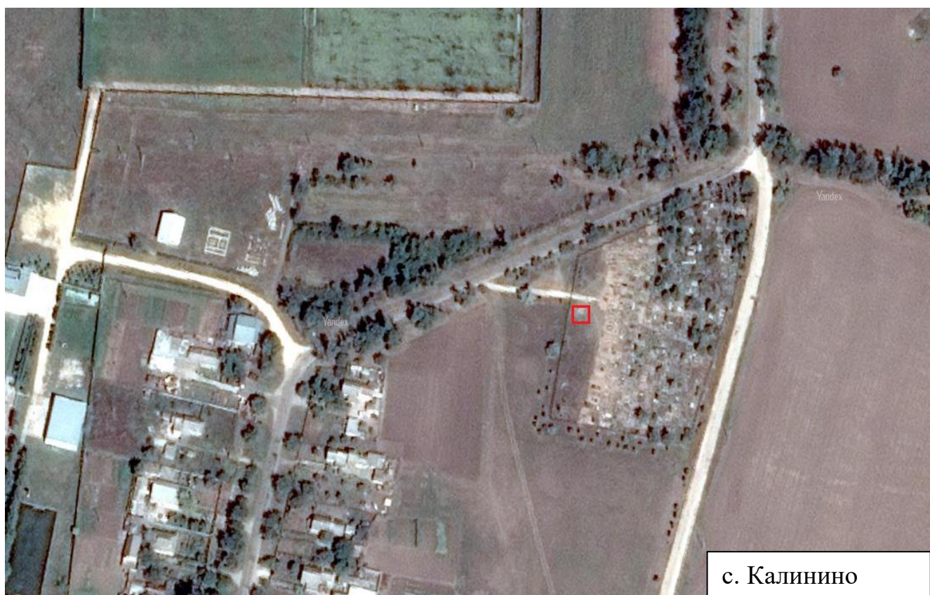
Схема дислокации контейнерной площадки по адресу: Республика Крым, Красногвардейский район, с. Калинино, ул. Колхозная, территория сельского кладбища

- Месторасположение контейнерной площадки