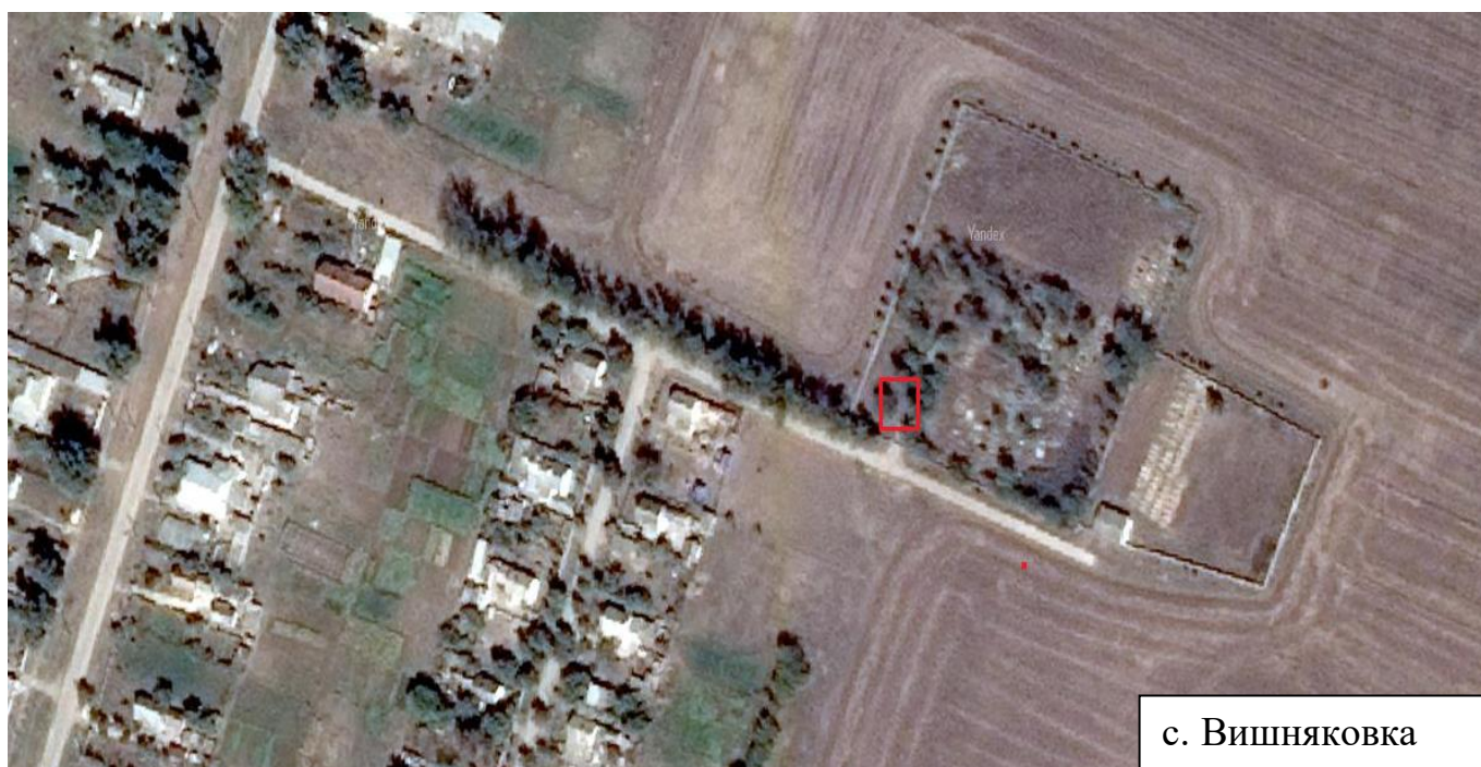
Схема дислокации контейнерной площадки по адресу: Республика Крым, Красногвардейский район, с. Вишняковка, территория сельского кладбища

- Месторасположение контейнерной площадки