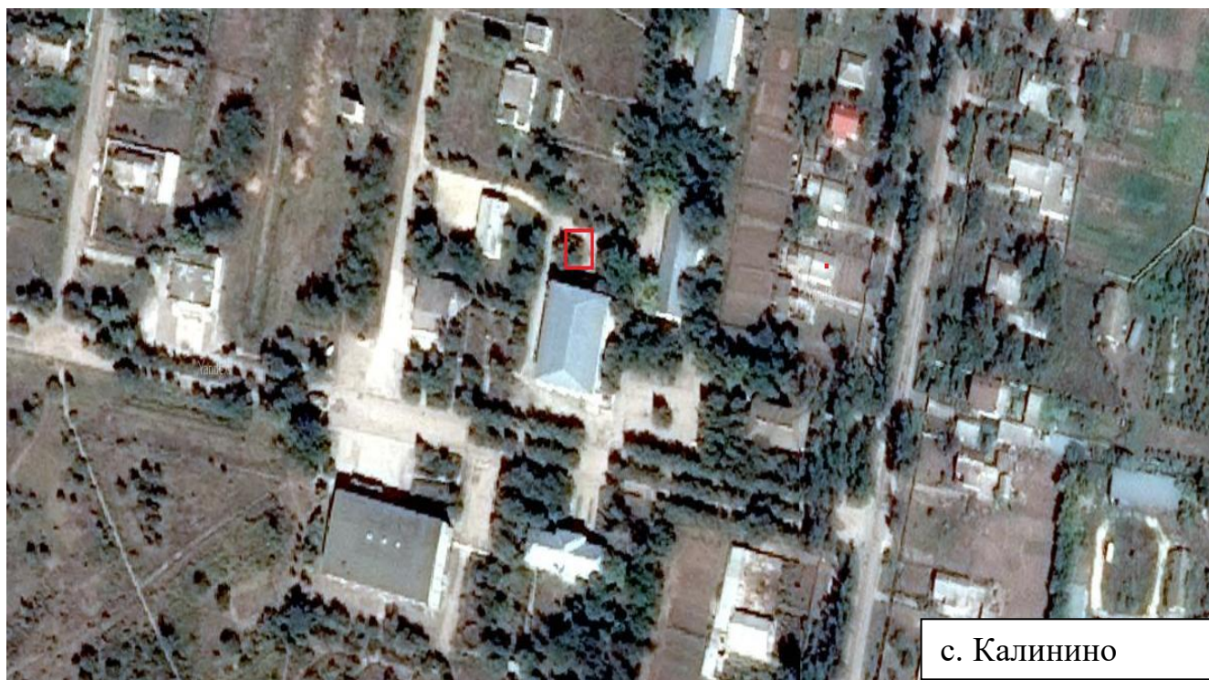
Схема дислокации контейнерной площадки по адресу: Республика Крым, Красногвардейский район, с. Калинино, ул. Калинина, 6

- Месторасположение контейнерной площадки